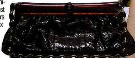
Pochette en cuir de reptile. 50€.

Ce qu'on aime: On ne fait qu'une bouchée des robes de soirée et des accessoires, pile poil dans la tendance style pochettes en croco.