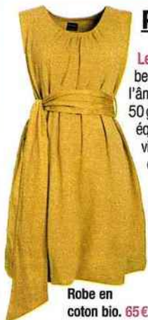
Robe en coton bio. 65€.