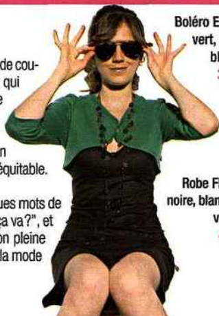
Boléro Elahé vert, noir, blanc. 34€.

Ce qu'on aime: On apprend quelques mots de portugais, "tudo bom?" signifiant "ça va?", et on se délecte devant cette collection pleine d'exotisme, s'inspirant tout droit de la mode des Cariocas, les habitants de Rio.