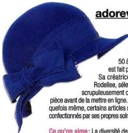
Chapeau en laine. 34€.

Pour se faire une garde-robe à tomber et à prix light, on n'hésite plus à voyager sur la Toile, hors des sentiers battus.