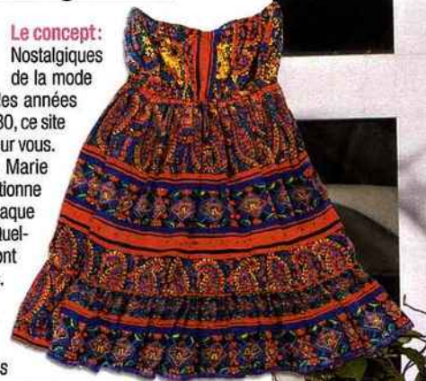
Robe bustier en soie. 63€.

Ce qu'on aime: La diversité des propositions, les prix accessibles, ainsi que quelques pièces rares mais essentielles.