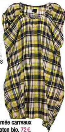
Robe imprimée carreaux en coton bio. 72€.

Ce qu'on aime: Des bijoux, des sacs, des vêtements confectionnés avec soin, toujours en phase avec les tendances du moment.