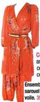
Ensemble sarouel en voile. 35€.